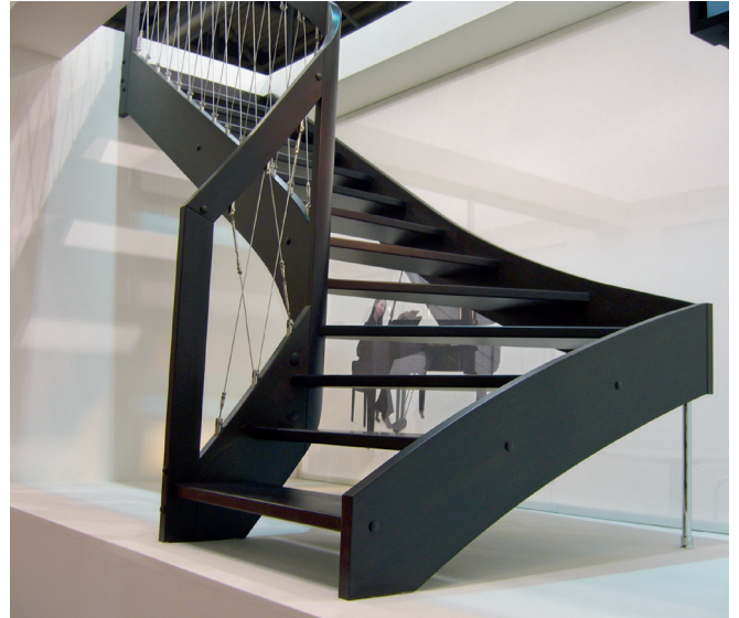
Die Kombination aus Edelstahl und massivem Holz zeichnet die individuell gefertigte Treppe aus. Farbe und Holzart können nach persönlichem Geschmack gewählt werden.