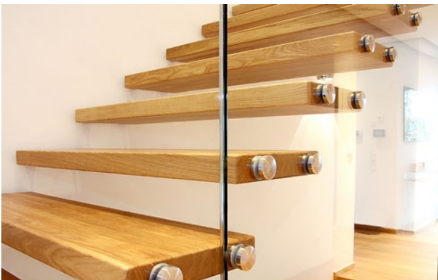
Die gummigelagerten Edelstahlbolzen dämmen nicht nur den Trittschall, sie sorgen auch für Eleganz und Modernität.