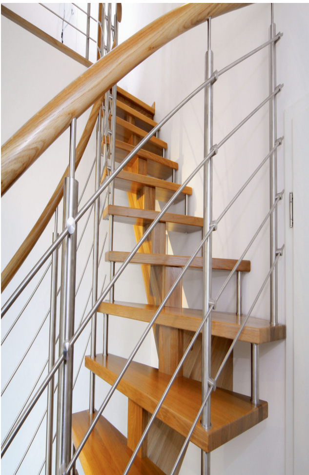
Diese Treppe hält ästhetisch und technisch höchsten Kundenansprüchen stand.

der runde Handlauf aus Eiche. Er erinnert von seiner Form her an Äste und harmoniert dadurch perfekt mit der schwungvollen Treppenform, die zudem einen sehr dynamischen und ästhetischen Eindruck vermittelt. Als weiteres sehr individuelles Detail fungiert die Eckstufe in der Wendung. Durch diese markanten Gestaltungsmerkmale erhält die Treppe eine sehr persönliche Note. Selbstverständlich erfüllt das Modell auch technisch höchste Ansprüche – nicht zuletzt dank der engen Zusammenarbeit zwischen STREGER und dem ausführenden Fachhandwerksbetrieb.