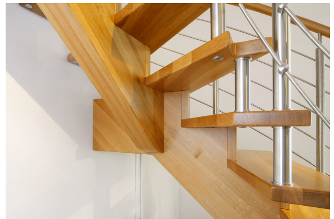
Eine markante Note erhält dieses Treppenmodell neben dem astähnlich geschwungenen, runden Handlauf durch die Eckstufe in der Wendung. Dank des Know-hows der Profis und der Wünsche des Kunden wird so aus dem Einrichtungsgegenstand Treppe ein persönlich gestaltetes Möbelstück.